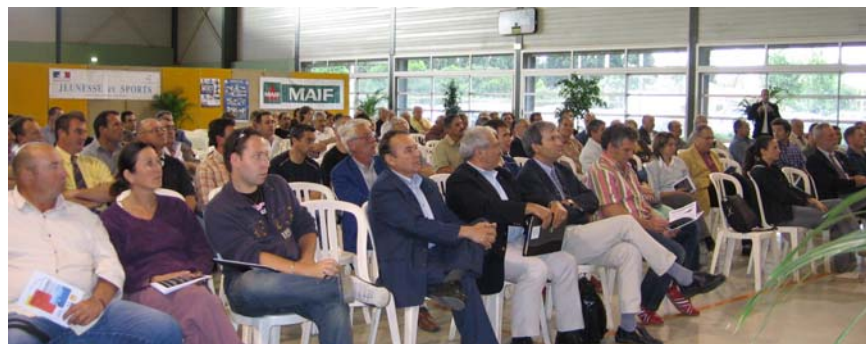
Une assistance nombreuse et intéressée