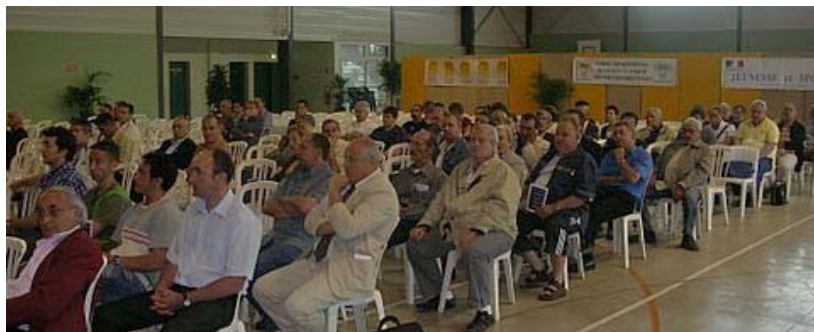
Le Maire de Pézilla la Rivière avait mis à disposition pour cette circonstance des installations parfaitement agencées et décorées