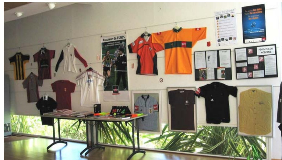
Mai 2007—Maison des Sports Exposition sur l'arbitrage avec la participation active des Commissions d'Arbitrage des Comités Départementaux

Le débat a été courtois et agréable Des perspectives ont été envisagées et la connaissance entre sports co et individuels améliorée de manière générale et en matière d'arbitrage en particulier.